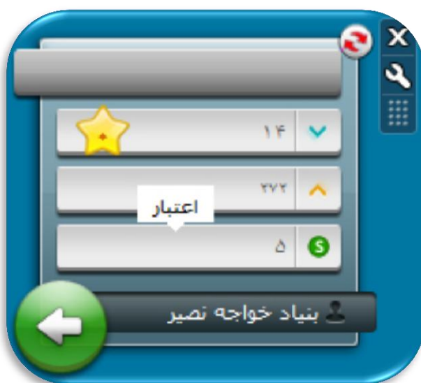
امکانات گجت ویندوز

با استفاده از این ابزار می‌توان گجت ویندوزی ارسال و دریافت پیامک را دانلود کرده و بر روی کامپیوتر نصب کرد. پس از نصب گجت، برای فعال‌سازی آن باید از نام کاربری و رمز عبور پنل کاربری استفاده شود. برای ارسال و دریافت از طریق گجت، کامپیوتر باید به اینترنت متصل باشد اما نیازی به ورود به سامانه نخواهد بود. گجت ویندوزی فقط روی ویندوزهای ویستا و ۷ قابل نصب و استفاده است.