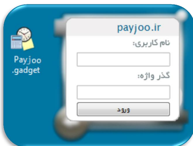
گجت ویندوز نصب شده بر روی کامپیوتر

با استفاده از این ابزار می‌توان گجت ویندوزی ارسال و دریافت پیامک را دانلود کرده و بر روی کامپیوتر نصب کرد. پس از نصب گجت، برای فعال‌سازی آن باید از نام کاربری و رمز عبور پنل کاربری استفاده شود. برای ارسال و دریافت از طریق گجت، کامپیوتر باید به اینترنت متصل باشد اما نیازی به ورود به سامانه نخواهد بود. گجت ویندوزی فقط روی ویندوزهای ویستا و ۷ قابل نصب و استفاده است.